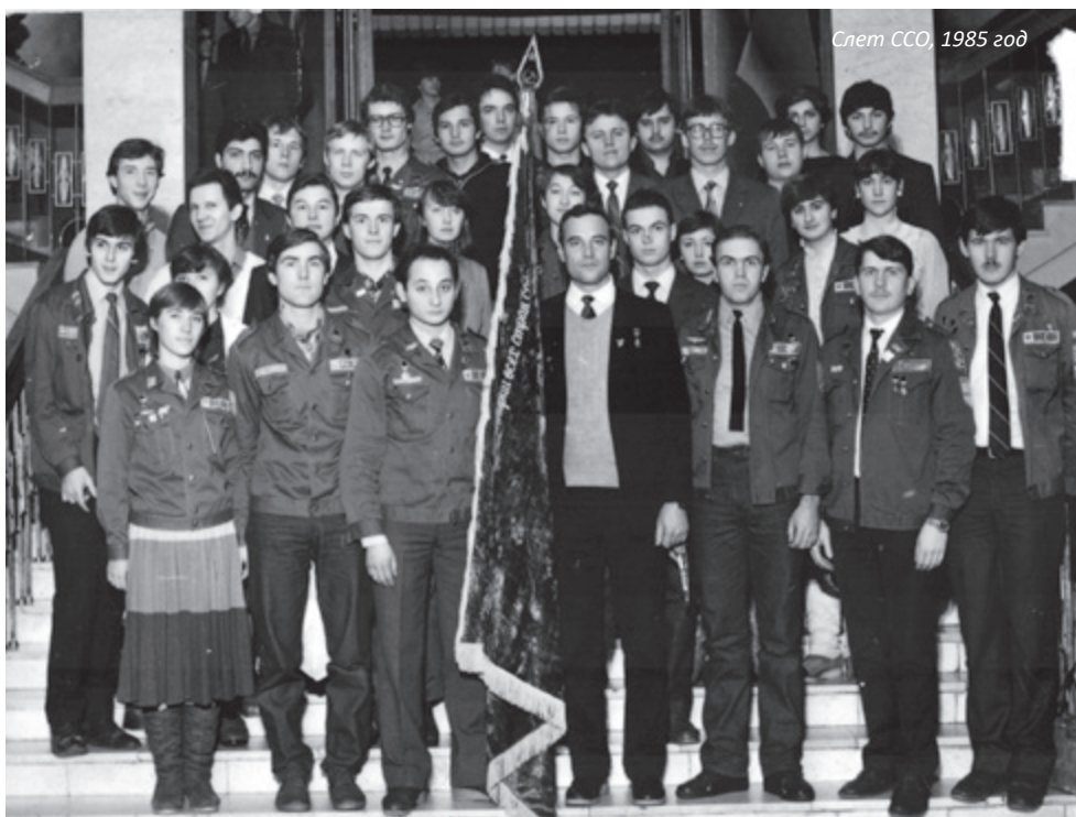
Слет ССО, 1985 год